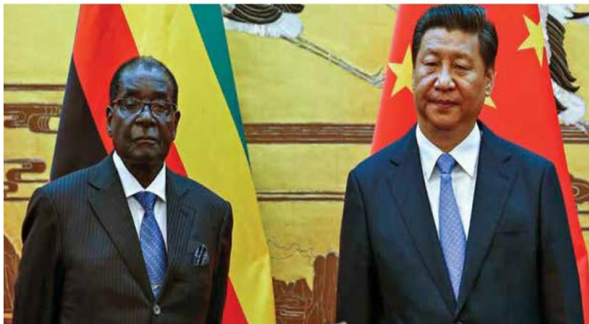
上图：穆加贝总统阁下与中国国家主席习近平， 在习主席 2015 年访问津巴布韦期间，决定加强双边经济和投资关系

美国和加拿大在内的许多国家。其中的亮点是中华人民共和国习近平主席对津巴布韦的国事访问。习近平主席访问期间，在各个经济领域，津巴布韦和中国之间签署了许多商业投资，这些都在实施的过程中。