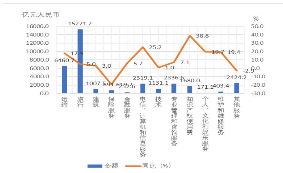
图 1 2017 年 1-9 月中国分行业服务进出口额及增速